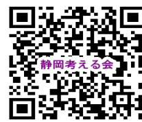
静岡福祉文化を考える会 QRコード