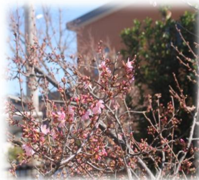
* 3月上旬 庭に咲いた“小桜”