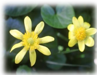
*春を呼ぶ「ヒメリュウキンカ」