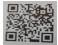
静岡福祉文化を考える会QRコード