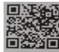
焼津福祉文化共創研究会QRコード

尊い、「赤い羽根共同募金助成事業」により、この10年間で、300セット作成した「若者発ご近所福祉かるた」は、各地から活用報告が届いている。更に「ご近所福祉」の推進を大いに期待したい。3年前から編集作業に取り組んできた本会『30年誌』は、12月末に発行の見通しとなった。「静岡発福祉文化の創造」をしっかりと検証したい。