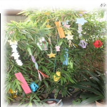
今年もしっかりと願い事を短冊に！