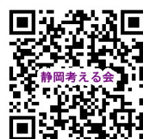
協働団体：静岡福祉文化を考える会QRコード