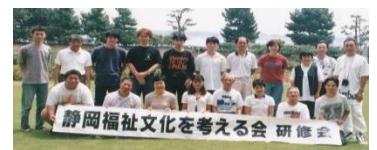
*若者中心の合宿セミナーで盛り上がる

昨年度から、「活動30年検証報告書」編集作業にむけて、山積みの資料や記録写真の掘り起こしをし、ようやく、第1章から第6章まで作業を進めている。あくまでも、静岡発(地方発)福祉文化の創造30年を検証する「タイトル：静岡発 福祉文化の創造軌跡30年 草創期からご近所福祉検証期を迎える」として位置づけ、県民に課題提起をする。決して「実績報告書」ではない。第1章から第9章と資料編として、各章の概要は下記のとおりである。