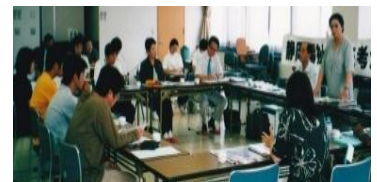
*第13回学会全国大会に向けた研修会