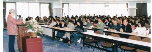
*「阪神淡路大震災の体験をとおして、21世紀の福祉文化を拓く」一番ヶ瀬初代会長の基調講演