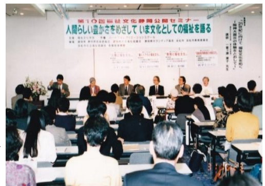
*「災害と福祉文化」議論が深まった現場セミナー