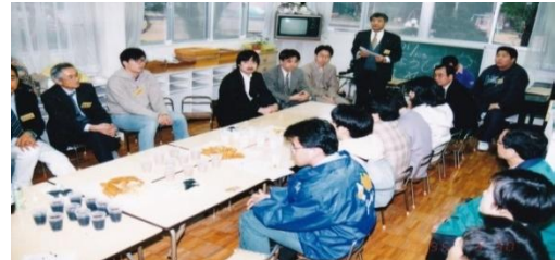
*有志40名により、「第11回学会現場セミナー」実現に向けた協議を積み重ねた

活動30年を迎える来年度(2025年度)は、県内各地に、確実に「静岡発(地方発)福祉文化の創造」を発信してきたかを検証する活動に取り組みたい。