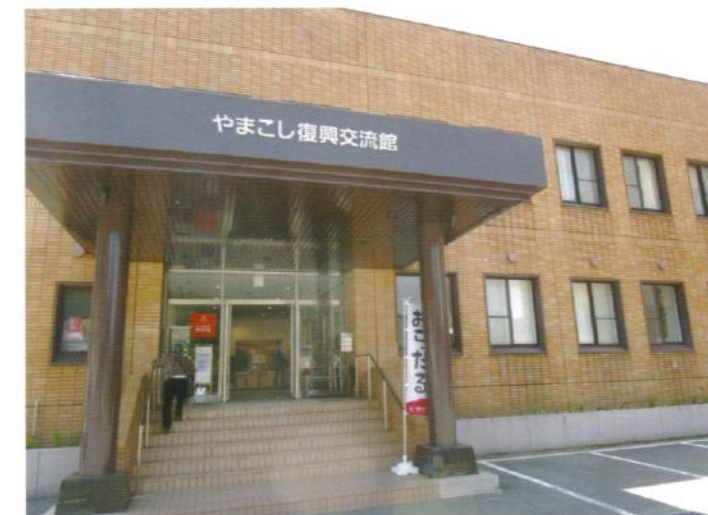
2日目の研修先 やまこし復興交流館

さらに、中越地震の際、全村避難となった山古志村(現在の長岡市山古志地区)『やまこし復興交流館おらたる』を訪ね、復興の状況について研修し、映画「掘るまいか」の手掘り中山隧道を見学するフィールドワークを行う。