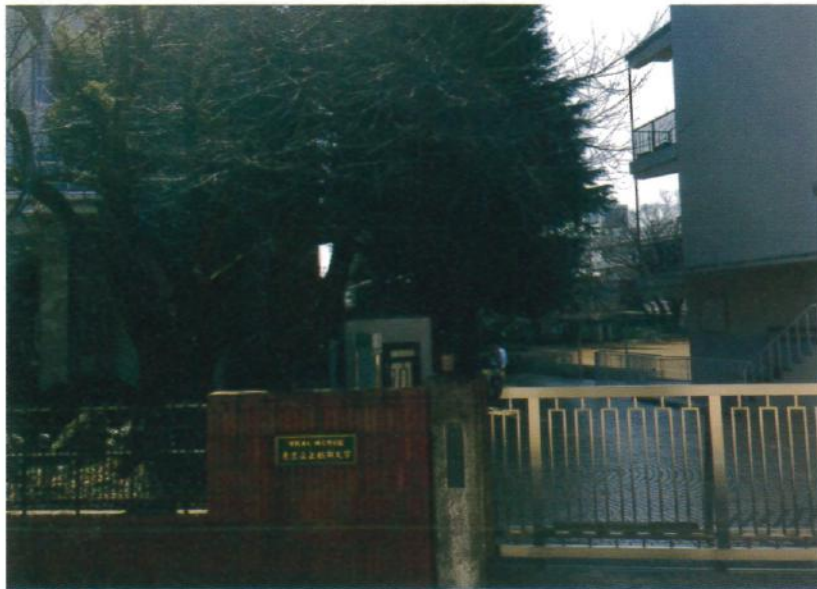
会場となる東京立正短期大学

日本福祉文化学会の原点に返り、 〈本学会ならではの〉開催地（東京） らしい、〈会場校（東京立正短期大 学）らしい、大会にすることを目的 に、「多様化する〈家族〉がひろく