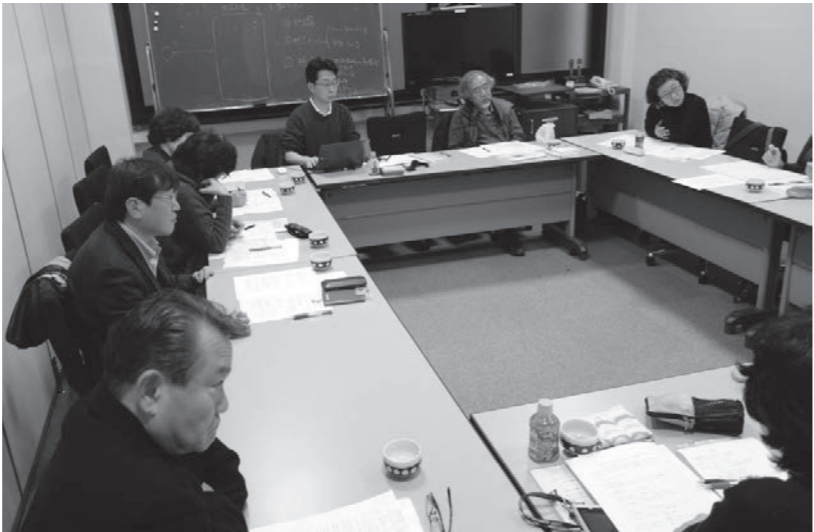
よもやまゼミナールの様子

を引き継いで、大分大会において何らかの報告ができるように「福祉文化よもやまゼミナール」を開催していく予定である。まずは手始めに3月2日(日)、新たなメンバーも加わって、今後の方向性について検討した。その結果、これまでの『福祉文化研究』掲載論文を「4つの視座」から分析、福祉文化研究のあり方を考えるとともに、ニューtralルで使いやすい定義の提案及び論文査読にあたってのガイドライン作りを考えていくこと、またゼミメンバーによる福祉文化研究のモデル研究になるような論文、レポートの提示を行うことなどを盛り込んだ報告書を2014年度末に向けて進めていくことを確認した。