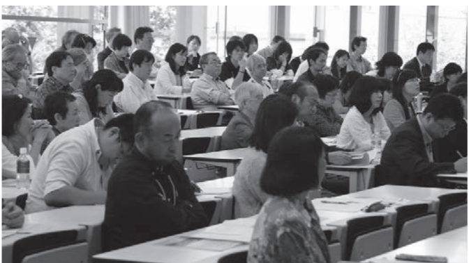
村長のお話に聞き入っています。

だから今こそ、「バランス」感覚を磨き、「いのちを大切に暮らす」を目指して、人々のつながりを取り戻す村づくりをやっていかなくてはならないと話された。