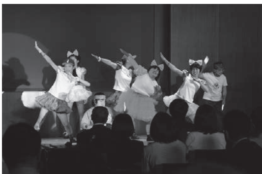
体験劇はるなが池袋にやってきた